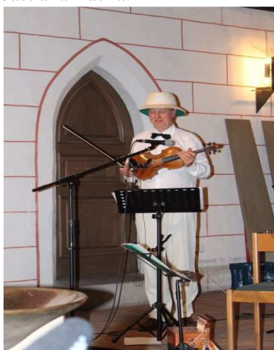
„Kwerthon.AB” i... Albert Schweitzer

Idealnym zakończeniem tego pełnego wrażeń dnia był koncert grupy „Khwaerthon.AB”, który miał miejsce w kościele p.w. św. Jakuba w Augsburgu. Grupa jest ewangelickim zespołem folkowym, który posiada w swoim składzie aż trzech aktywnych pastorów. Muzycy zaprezentowali ciekawy program poświęcony przede wszystkim Albertowi Schweitzerowi i jego idei „Czci dla życia”, oczywiście nie zabrakło przy tym utworów uwielbianego przez sławnego organistę kompozytora - Jana Sebastiana Bacha.