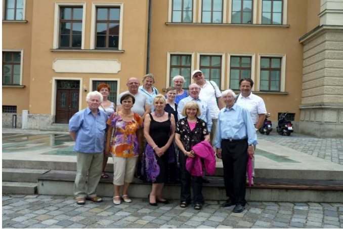
Grupa uczestników konferencji w Augsburgu.